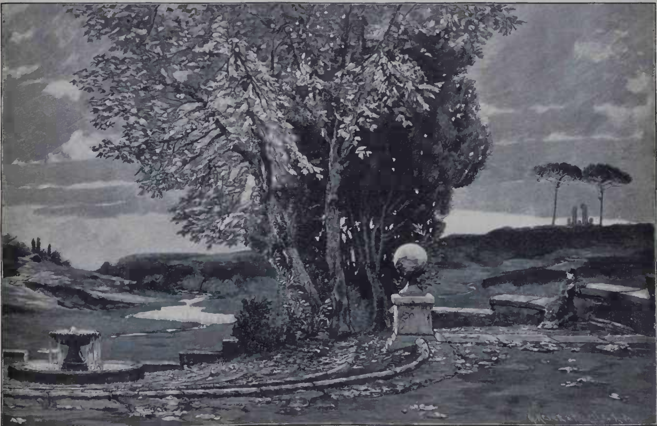
CAMPAGNA DI ROMA

Os babados, bem sabeis, contam entre as guarnições um lugar bem invejavel e a moda em seu